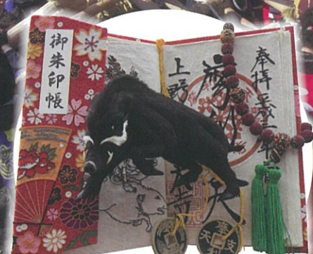
平成31年 優勝ダシ作品 (第11区)